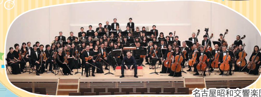
名古屋昭和交響楽団