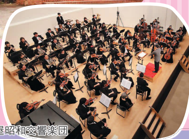
名古屋昭和交響楽団