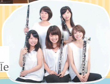
Clarinet みたらしだんご Ensemble