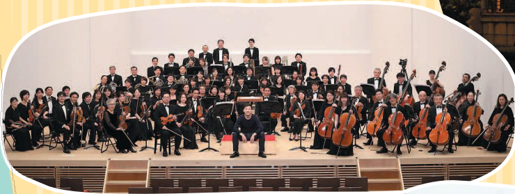
名古屋昭和交響楽団